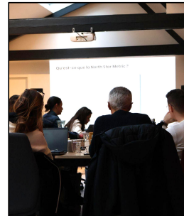
Content Marketing Janvier 2023