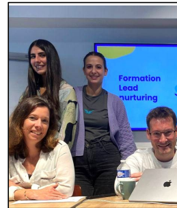
Lead nurturing Septembre 2022