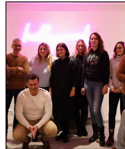
LinkedIn Novembre 2022