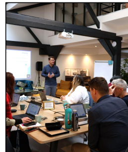
Charte éditoriale Juin 2022